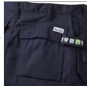
Rymliga bakfickor med tryckknappar och lock.