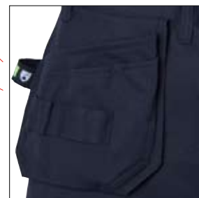
Löst hängande spikfickor – den högra med tre extra fickor och verktygshållor.