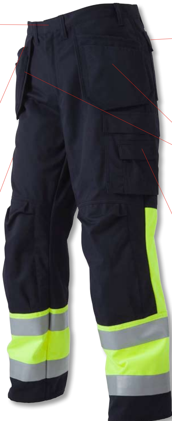
Tumstocksicka med verktygsficka, pennficka och knivknapp och -hålla.